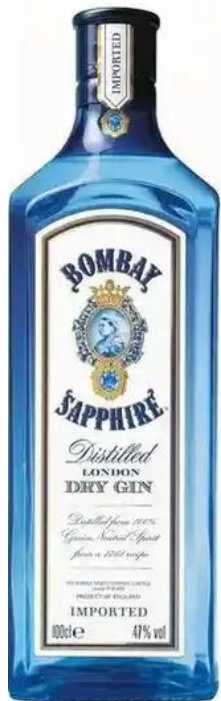
BOMBAY x 750 ml