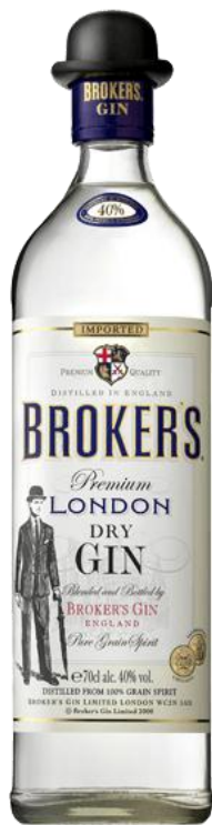
BROKER'S LONDON DRY x 750 ml