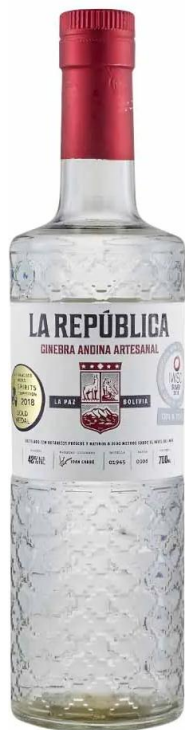
LA REPUBLICA ANDINA x 750 ml