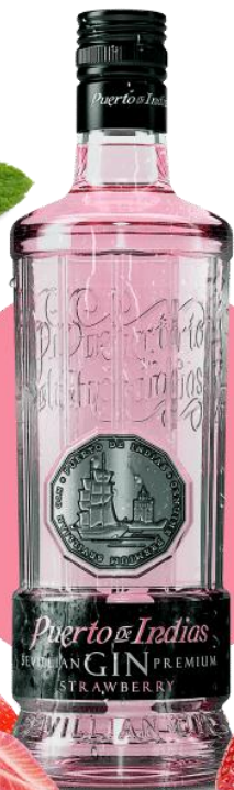
PUERTO DE INDIAS STRAWBERRY x 750 ml