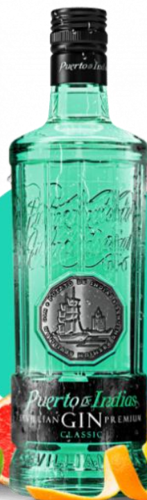
PUERTO DE INDIAS CLASSIC x 750 ml