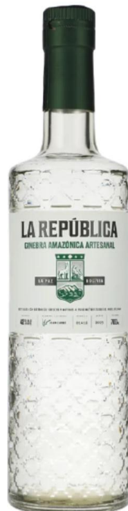
LA REPUBLICA AMAZONICA x 750 ml